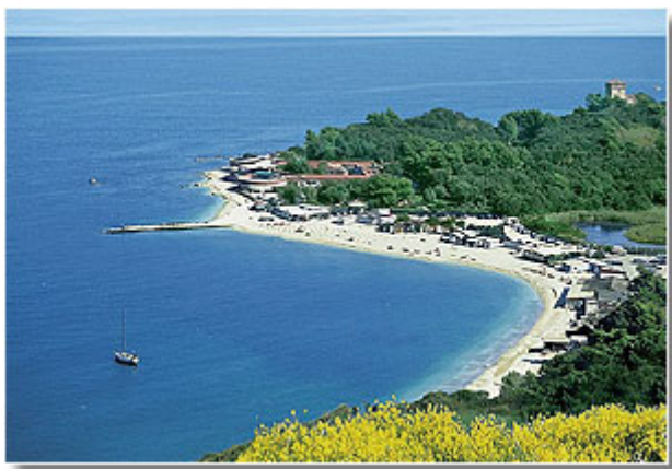
La Baia di Portonovo

Sherlock Holmes, protagonista di questa spy-story ambientata nella provincia di Ancona, si trova al centro di vicende e incontri tutti storicamente credibili, descritti con ironia da Joyce Lussu in uno dei suoi testi più atipici e singolari. Nel finale del libro l'investigatore aiuta un vecchio anarchico ad introdursi nelle gallerie del Monte Conero, pronto a sacrificare la vita per distruggere le torpedini nemiche. Ma in un inutile e ridicolo duello tra due diplomatici tedeschi un ragazzo che li aveva aiutati perderà la vita per un colpo di pistola deviato da un albero. Holmes, deluso da questa giovane vita inutilmente spezzata, ripartirà tristemente alla volta dell'Inghilterra. In un mese il libro era pronto e questo insolito "caso" del famoso detective, che diventa paladino pacifista, sarà l'ultima delle narrazioni della scrittrice, contagiata come altri dalle atmosfere della "provincia" italiana, dove sembra non succedere mai nulla, scelta spesso per suggestiva ambientazione di racconti e romanzi.