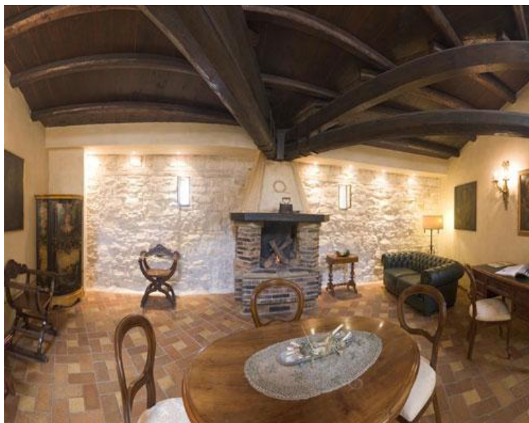
Una delle suite dell'Hotel Fortino Napoleonico

Trasformato in albergo nel 1969 dopo imponenti restauri, ma con pieno rispetto delle strutture originarie, il "Fortino Napoleonico" è oggi uno degli hotel più suggestivi e romantici della costa adriatica.