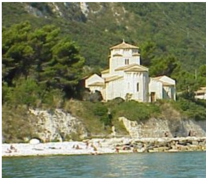
Chiesetta di Santa Maria di Portonovo

Santa Maria di Portonovo è una splendida abbazia romanica edificata dai Benedettini a partire dal 1034, in seguito ad una donazione di alcuni signori del Poggio. Abitata per tre secoli dai monaci, che la ampliarono con un convento oggi distrutto, fu abbandonata per una frana nel 1320. Dopo aver subito i saccheggi turchi fu restaurata alla fine dell'800 dal Sacconi e riaperta al culto nel 1934. Rifacendosi a versi danteschi alcuni sostengono che ospitò San Pier Damiani, fondatore dell'eremo di Camaldoli. Le linee, sobrie e armoniose, ricordano i modi costruttivi lombardi, mentre la cupola è d'ispirazione bizantina. Dalle finestre delle absidi, rivolte verso il mare, entra la luce del sole nascente che illuminava il canto mattutino dei monaci.