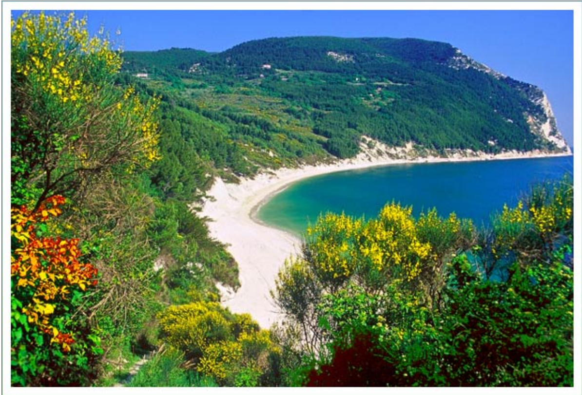
Veduta del Parco Regionale del Monte Conero

Gioiello del Parco è la baia di Portonovo, dove la macchia mediterranea arriva a toccare l'acqua cristallina del mare. La spiaggia risplende dei bianchi ciottoli di pietra, levigati continuamente dalle onde. Due laghetti salmastri circondati da un fitto canneto di giunchi e canne da palude fanno da rifugio ad un consistente numero di germani reali, gallinelle d'acqua, martin pescatori e tuffetti, oltre a volatili migratori in alcuni periodi dell'anno.