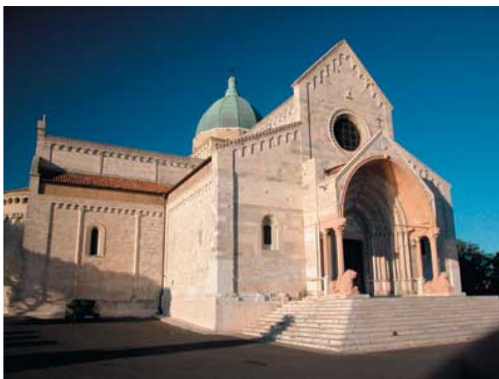
Cattedrale di San Ciriaco, Patrono della città di Ancona

“Le dirò che il nome di questa città deriva dal greco “Ancon”, gomito, e che si trova, se vuole considerare l’Italia come uno stivale, sul punto più alto del polpaccio. È un’antica colonia dorica e il suo porto è stato sempre importante per la navigazione sull’Adriatico. La cattedrale di San Ciriaco è riprodotta in tutti i manuali di storia dell’arte, per le sue caratteristiche di uno stile romanico arricchito da leggere influenze gotiche”.