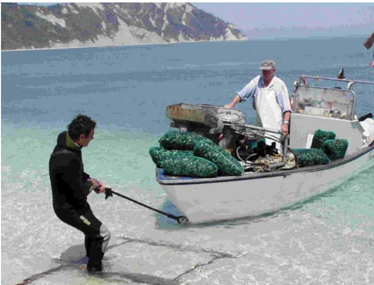
Pescatori della baia di Portonovo

Gioiello del Parco è la baia di Portonovo, dove la macchia mediterranea arriva a toccare l'acqua cristallina del mare. La spiaggia risplende dei bianchi ciottoli di pietra, levigati continuamente dalle onde. Due laghetti salmastri circondati da un fitto canneto di giunchi e canne da palude fanno da rifugio ad un consistente numero di germani reali, gallinelle d'acqua, martin pescatori e tuffetti, oltre a volatili migratori in alcuni periodi dell'anno.