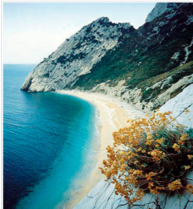
La spiaggia delle “Due Sorelle”

“Si è sempre anche favoleggiato di grandi mostri marini e di orche che emergono tra le scogliere ai piedi del Conero, e la favole è dura a morire: pensate, Holmes, che poche settimane fa un pescatore mi assicurava di aver visto, in una notte di plenilunio, un immenso squalo uscire da un antro sottomarino e nuotare a pelo d’acqua verso il largo, con l’alta pinna emergente, per poi inabissarsi e sparire”.